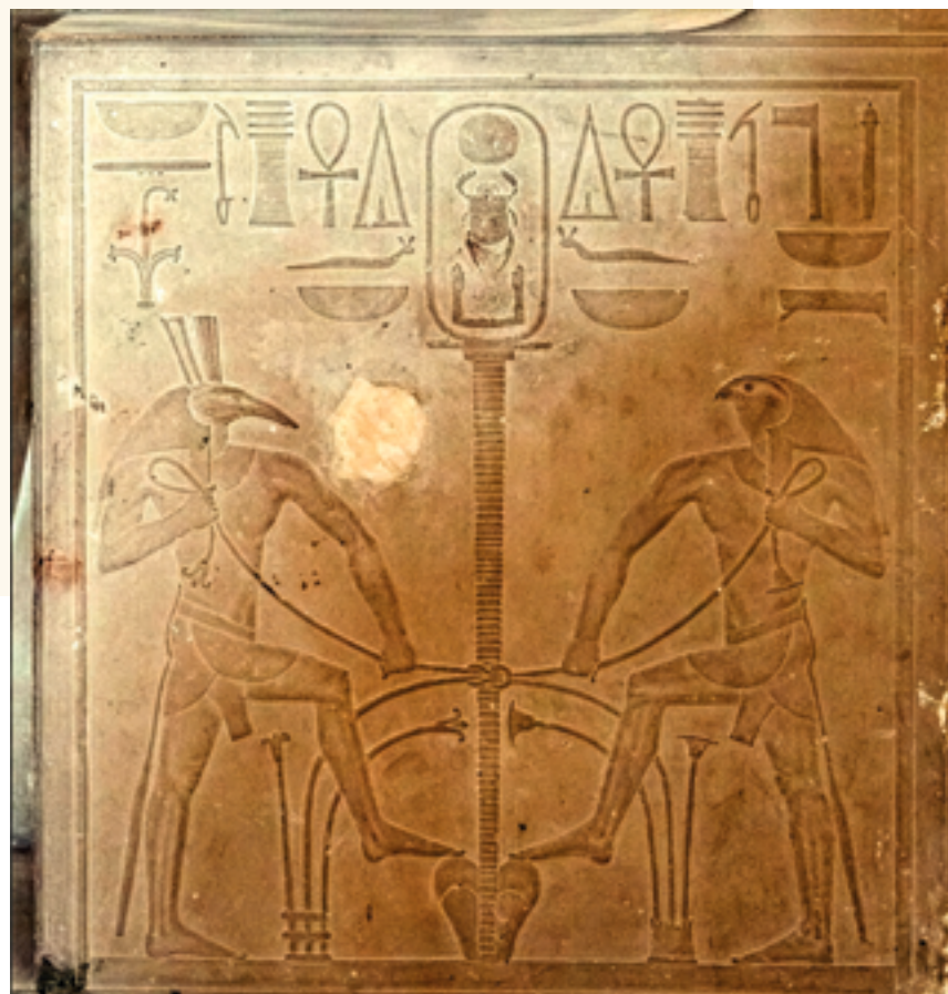
Statue du roi Sésotris I er de Lisht : Sema Taoui avec Horus et Seth, Grand Musée Égyptien, Le Caire, Égypte.